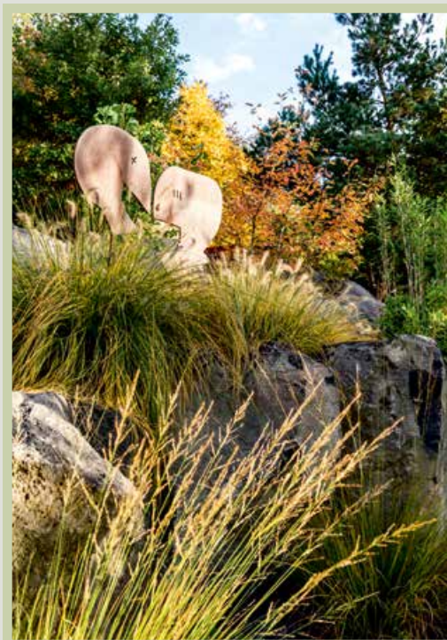
FOTO RECHTS: Miscanthus sinensis 'Gracillimus' und Miscanthus sinensis 'Goldglanz' bilden den natürlichen Kontrast zur formalen Architektur. Deren Höhenspiel unterstreicht die Lebendigkeit der Hangbepflanzung.

FOTO LINKS: Als wunderbare Begleiter erweisen sich Gräser auch für eine unaufdringliche Skulptur (Marti Faber, Euskirchen). Trockenheitsresistente Sorten wie Molinia caerulea fühlen sich am Hang besonders wohl.