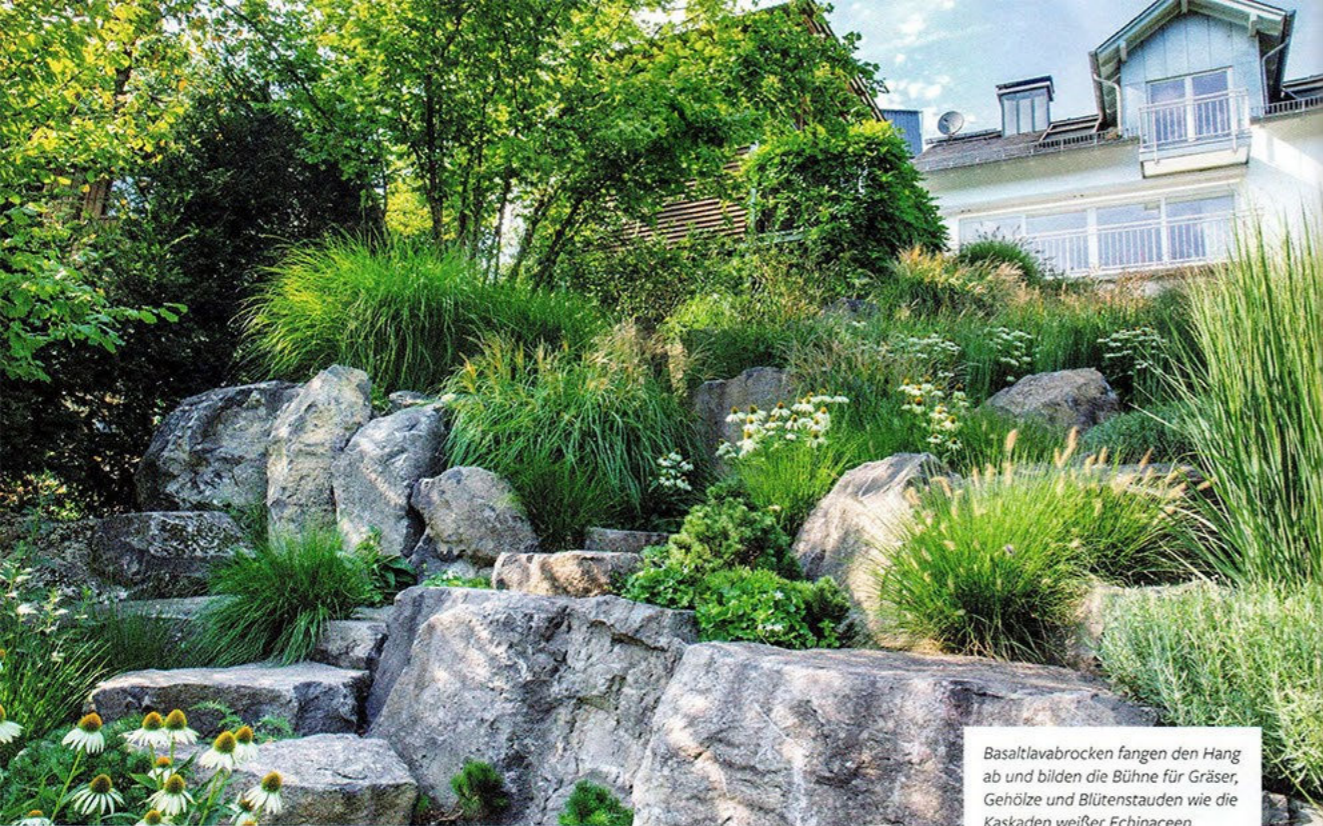
Basaltlavabrocken fangen den Hang ab und bilden die Bühne für Gräser, Gehölze und Blütenstauden wie die Kaskaden weißer Echinaceen.