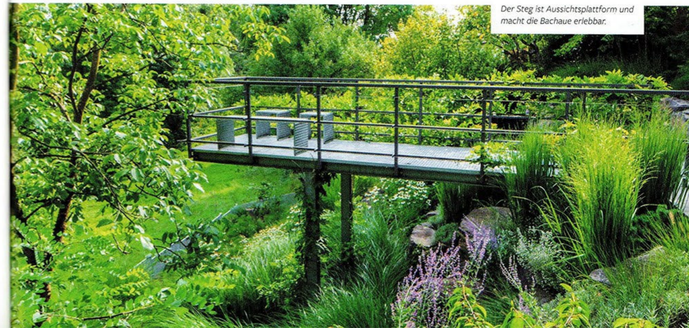
Der Steg ist Aussichtsplattform und macht die Bachau erlebbar.

Stand vor der Umgestaltung die Wertschätzung für den Garten nicht im Vordergrund, so nehmen die Besitzer ihren Garten nun als Kraftquelle und Rückzugsort wahr. Das Verhältnis hat sich mit den Jahren umgekehrt. Beim Ferienhausprojekt sind Gartenplanung und -bau federführend. Der Gartenplaner suchte mit der Bauherrschafft den Hochbauarchitekten aus. Die Idee mit dem Aussichtssteg wird aufgegriffen und dabei der Blick über die Mosel in Szene gesetzt.